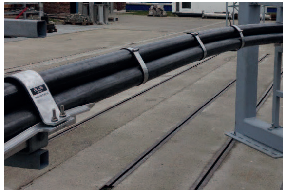
EIN FOTO DES KURZSCHLUSSPRÜFSTANDES FÜR CENTAUR DREIPASS. DIE TESTS WURDEN IN DEN ZKU-LABORATORIEN IN PRAG, CZ, DURCHFÜHRT.

Die Centaur Dreipass-Kabelsättel sind zur Aufhängung von Hochspannungskabeln in Dreiecksformation entlang Stahlkonstruktionen mit einer typischen Länge von 3 - 8 m konzipiert. Die Anordnung besteht aus einem stranggepressten Aluminiumsattel und einem mit Scharnier versehenen Aluminium-Oberband. Die Krümmung des Sattels nimmt die thermische Ausdehnung des Kabels auf; die Enden des Sattels sind konisch erweitert, so dass die Kabel nicht mit einer scharfen Kante in Berührung kommen können. Centaur Dreipass ist in Längen von 400, 600 und 800 mm für unterschiedliche Kabeldurchmesser und Montageabstände erhältlich. Centaur Dreipass ist projektspezifisch und es können deshalb keine Sortimentsdetails angegeben werden. Bitte kontaktieren Sie Ellis für weitere Informationen.